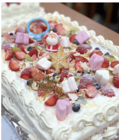
クリスマス会のケーキが毎年楽しみ

給食事業の法人化をはじめ、自社商品開発、助成金の活用、Facebook 運営といった、売上拡大に関する重要な経営判断が必要な時に、現状の把握、課題の抽出、実行計画策定及び実行を支援した。学童施設を買収に向けたアプローチ方法もアドバイスした。