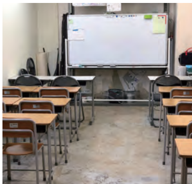
宿題もはかどる教室スタイルの勉強部屋